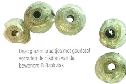
Deze glazen kraaltjes met goudstof verraden de rijkdom van de bewoners