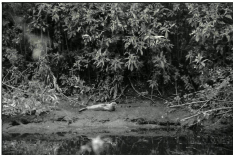
Foto 1. De zeehond in het slijk op de oevers van de Zenne, waar de rivier maar een 5-tal m breed is.