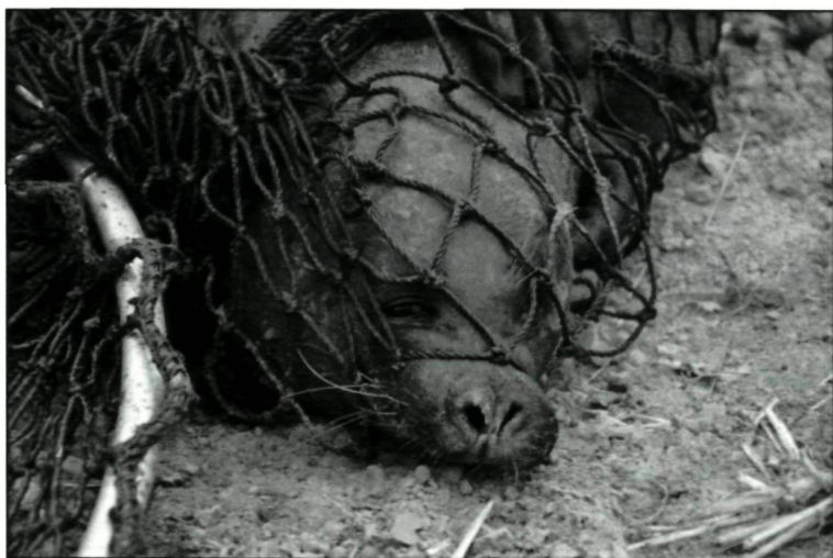
Foto 2. Het gevangen dier. Het werd te SeaLife Blankenberge beschreven als een zeer mooi dier, met een dikke donkere kop.