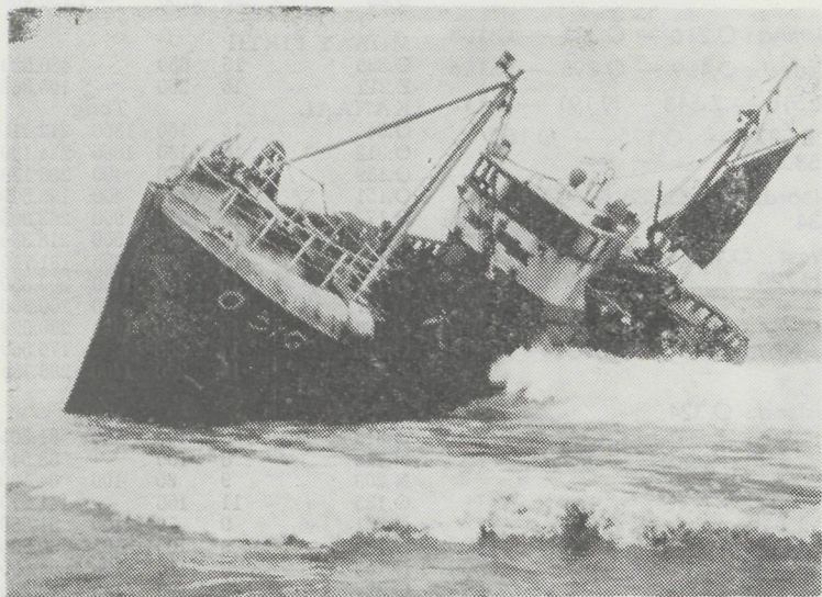
De O.315 « Beatrice-Fernande » die in dramatische omstandigheden verging op de Schotse kust, en waarbij 3 opvarenden het leven verloren.

meteen de grootste houten treiler wordt welke ooit op een Oostendse scheepswerf gebouwd. Het vaartuig was uitgerust met een Werkspoor-Dieselmotor van 336 P.K. en kwam op 22 september 1947 in de vaart.