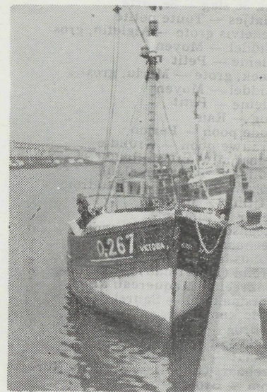
De O.267 « Victoria » die in 1945 in de vaart kwam.

In het jaar 1945 werd overgegaan tot de oprichting van een naamloze vennootschap, terwijl nog in hetzelfde jaar tot de bouw van twee nieuwe treilers, nl. de O.267 « Victoria » en de O.532 « Stormvogel », die beiden nog in hetzelfde jaar in de vaart kwamen. Ook de O.90 « Mady II » werd aangekocht door de rederij, maar dit vaartuig bleef slechts korte tijd eigendom van de rederij Boels N.V.