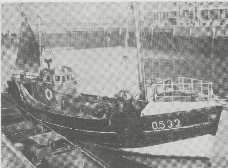
De O.532 « Stormvogel », die ondermeer in december 1957 een mijn de haven binnenbracht.

In 1956 wordt overgegaan tot de aankoop van de O.305 « François Musin » die tot dan toe eigendom was geweest van de Motorvisserij. Inmiddels werden verscheidene schepen van de rederij gemoderniseerd.