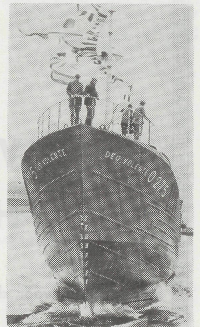
Statig glijdt de O.275 « Deo Valente » van stapel.

Hij wijst erop dat er ingevolge de economische reglementering wel enige beperking is ontstaan, maar dit dan om redenen waarover hij voorlopig niet verder kan uitwijden, maar die in ieder geval ten voordele van onze eigen werven zullen uitdraaien. Hij geeft toe dat in de laatste periode wel enige vertraging kon waargenomen worden bij het toekennen van de kredieten maar dit uitsluitend dient toegeschreven te worden aan administratieve redenen. Hij is evenwel persoonlijk tussengekomen bij de Minister van Verkeerswezen om hierop te wijzen.