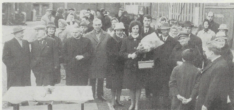
Een blik op de drukke belangstelling tijdens de tewaterlating.