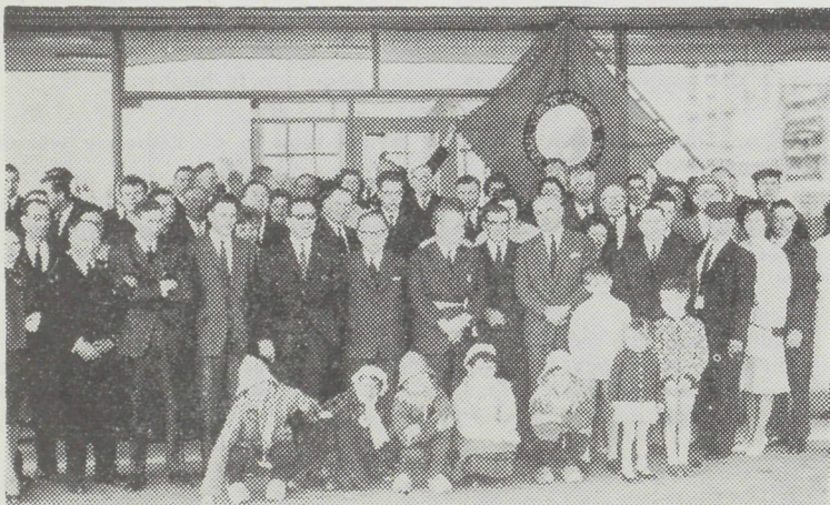
Een groepsfoto van het lustrum der visventers, met vooraan de personaliteiten.