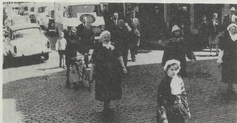
De optocht der viswagens door de Oostendse straten.