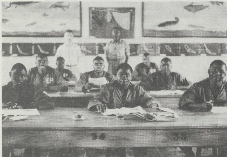
In Kongo werd in 1952 de eerste visserijschool van Afrika geopend. Deze instelling verschaft de inlanders van alle gewesten in drie jaar onderwijs in de visserijtechniek en bijhorende vakken met het doel tot een rationele exploitatie te komen van het kapitaal vis.