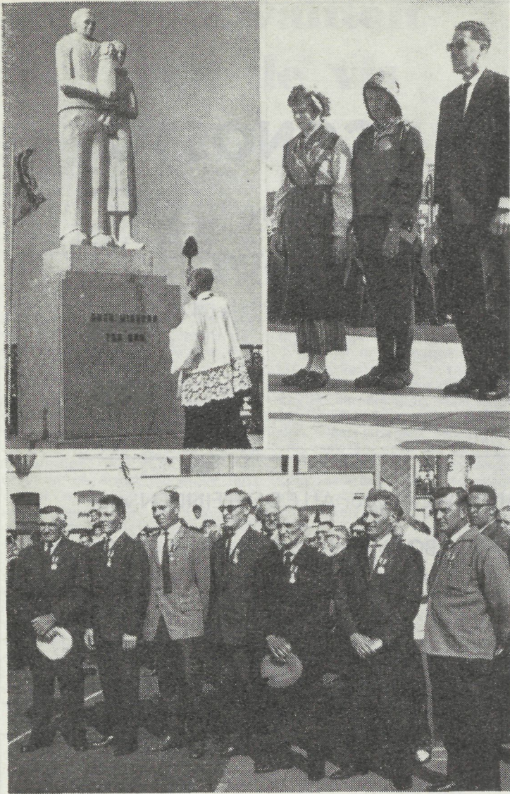
Een blik op de plechtigheden te Heist aan Zee tijdens de inhuldiging van het Vissersmonument. Boven de eigenlijke inhuldiging door minister Van Elslande, en onderaan de vereremerken.