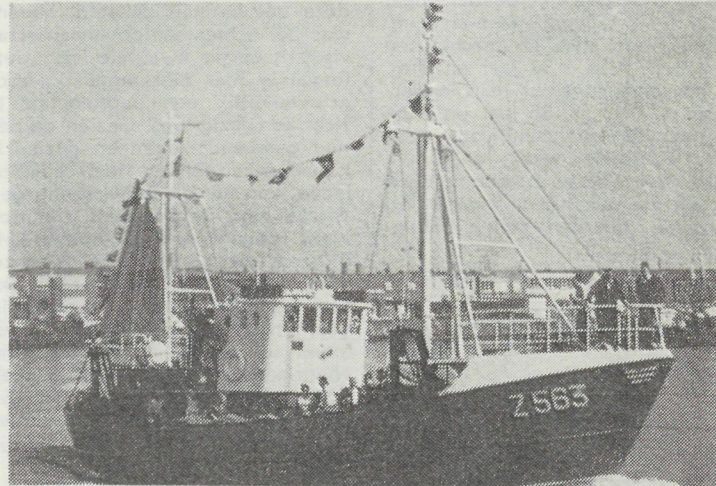
BOVEN : de bemanning van het nieuw vaartuig Z.563 « Zee Adelt ». MIDDEN : een zicht tijdens de doopplechtigheden. ONDER : het nieuwe vaartuig verlaat de haven voor de maiden-trip.