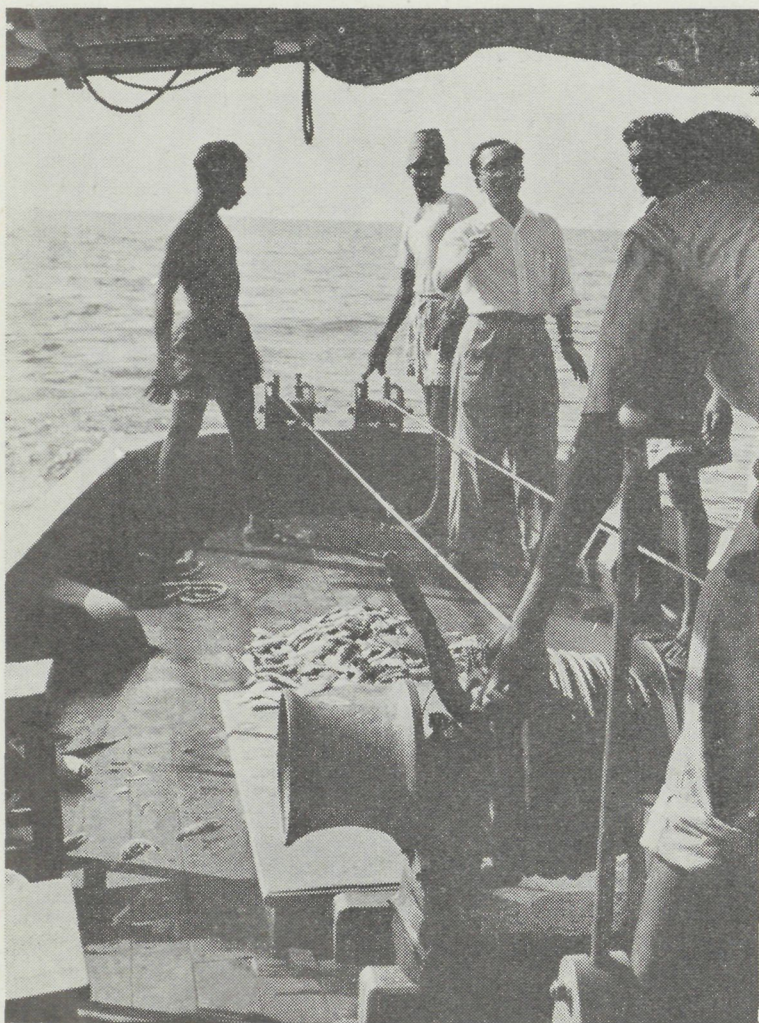
Door het « Central Fisheries Technological Research Station » te Cochín in Indië worden proefnemingen gedaan in verband met vistuig en materiaal. Dit station werd in 1957, dank zij de hulp van de F.A.O. opgericht en sedertdien werd reeds heel wat bereikt in het kader van personeelopleiding en nieuwe visserijmethodes. Op de foto F.A.O.-expert K. Miyamoto uit Japan tijdens de tewaterlating van de korre voor een nieuwe sleep.

In de U.S.A. bvb. en meer bepaald in de Golf van Mexico, drijven de vissers de garnalen bij middel van elektrische schokken in de richting van hun netten. Ziehier hoe hiervoor wordt tewerk gegaan: in betrekkelijk heldere wateren, zoals ook deze van de Golf van Mexico schuilen de garnalen tijdens de dag in de zandige bodem, maar trekken, eens de duisternis is ingevallen naar de oppervlakte. Aldus is de sleepnetvisserij beperkt tot de enkele nachtelijke uren. Allerlei methodes werden uitgedacht