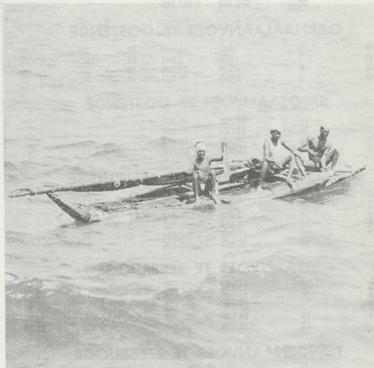
Terwijl zeevogels een feestmaal genieten... lijden miljoenen mensen honger.

Men zou kunnen zeggen dat, sedert het begin van het mensdom, de vissende volkeren er steeds naar getracht hebben de vis te bewaren en te vervoeren. De Egyptenaren hadden reeds duizenden jaren terug methodes uitgedacht voor het zouten en het distribueren van de vis in de binnenlandse gebieden? De oude Romeinen waren erin geslaagd een vissubstantie te bereiden, die zeer gegeerd werd als specerij, en die in hoge mate bijdroeg tot een opvoeren van de voedingswaarde der gerechten. Nog andere volkeren lukten erin andere oplossingen te vinden voor deze oude en moeilijke problemen.