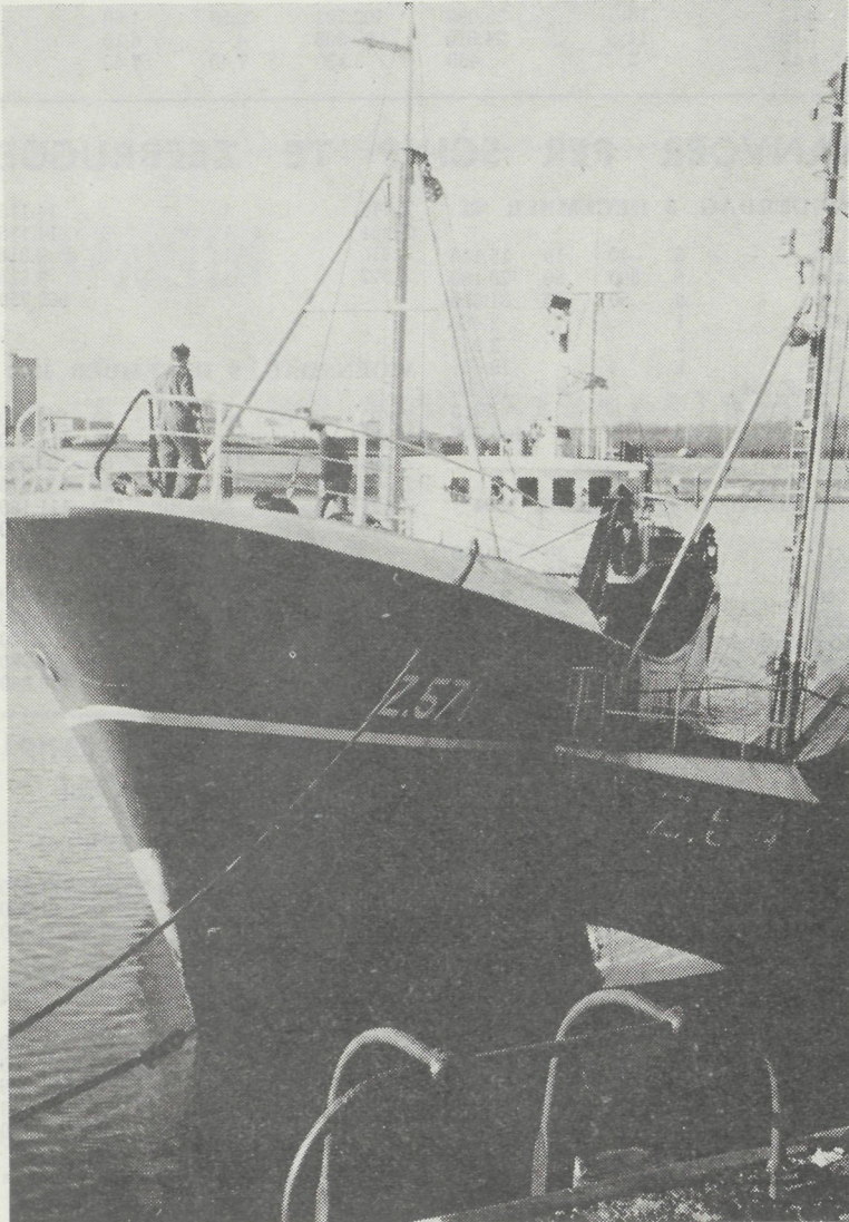
De Z.571 «Zephyr» tijdens de aankomst in de Zeebrugse vissershaven.

TWEE IJSLANDERS VOOR ZEEBRUGGE IN 2 WEKEN TIJD