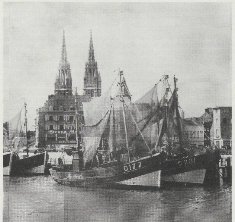
De O.177 «Mijn Droom»

Langzaam aan kregen de toestanden opnieuw het aspekt van vóór de oorlog, en kon opnieuw ter visserij worden uitgevaren. Zo ging dit door tot in 1951 de O.100 verkocht werd aan schoonzoon Constant en «Barbeetje» een groter schip aankocht, nl. de O.177 «Mijn Droom» die vooraf eigendom was geweest van Pol Hagers. Het scheepje werd volledig nagezien en vernieuwd, en de 40 PK motor vervangen door een motor van 100 PK.