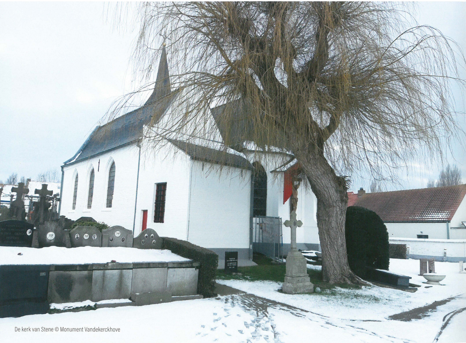
De kerk van Stene

Toen archeologen van Monument Vandekerckhove onderzoek voerden in de grond van de Sint-Annakerk van Stene, nabij Oostende, behoorden grafzerken tot de verwachting. Maar van een 14de-eeuws riddergraf in de vloer van het pittoreske kerkje had niemand durven dromen. Wat zou het verhaal achter deze belangrijke persoon kunnen zijn?