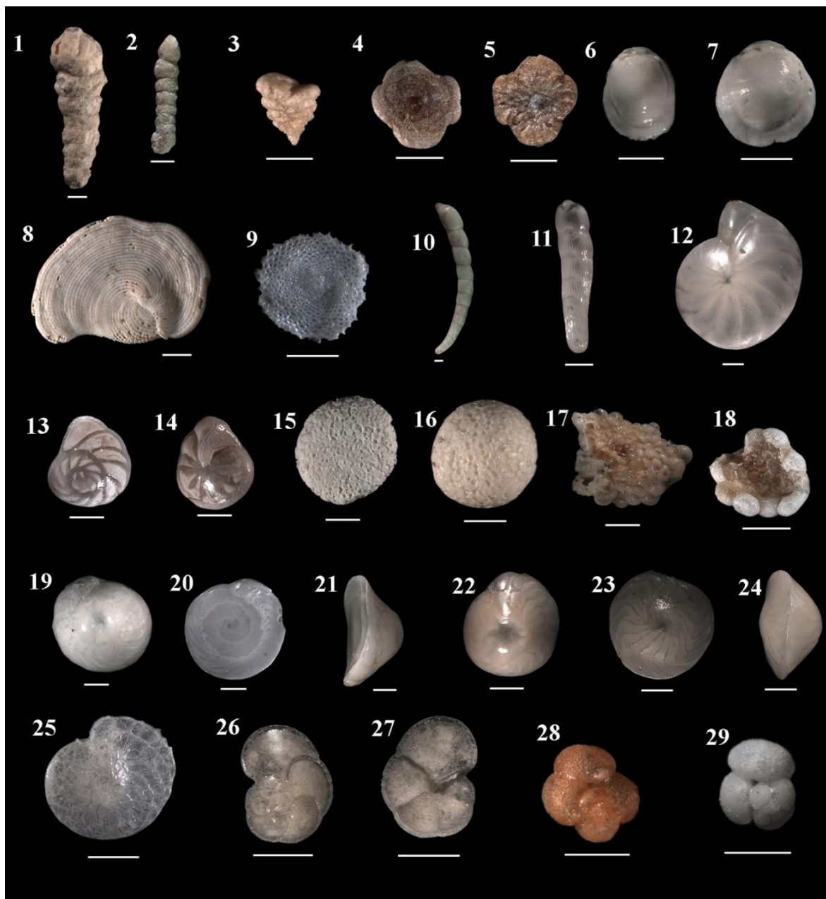
Figura 2. Fotomicrografias à lupa estereoscópica Zeiss Discovery V12. Escala: 500 µm.