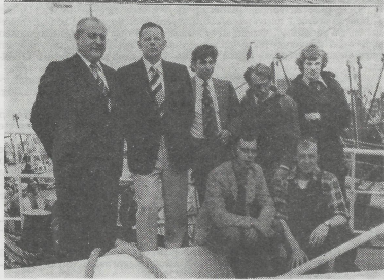
Twee beelden van de doopplechtigheid met bovenaan de prachtige treiler en onderaan reder, scheepsbouwer en bemanning.