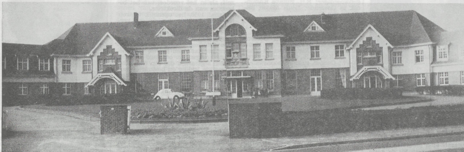
Het Zeemanstehuis Godtschalck, sedert vele jaren een veilige baken voor de vele zeelui die nu een welverdiende rust genieten.