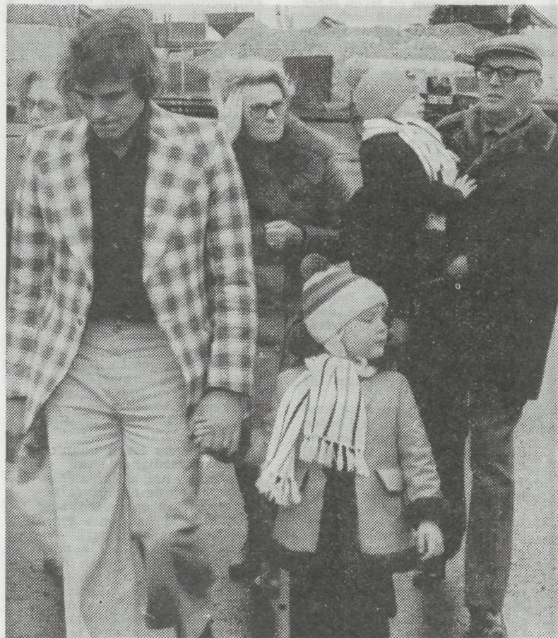
Ontroerend weerzien: de geredden met familieleden.