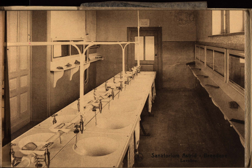
Sanatorium Astrid - Bredene Lavabo

Œuvre du Grand Air - Gand. Werk der gezonde Lucht - Gent.