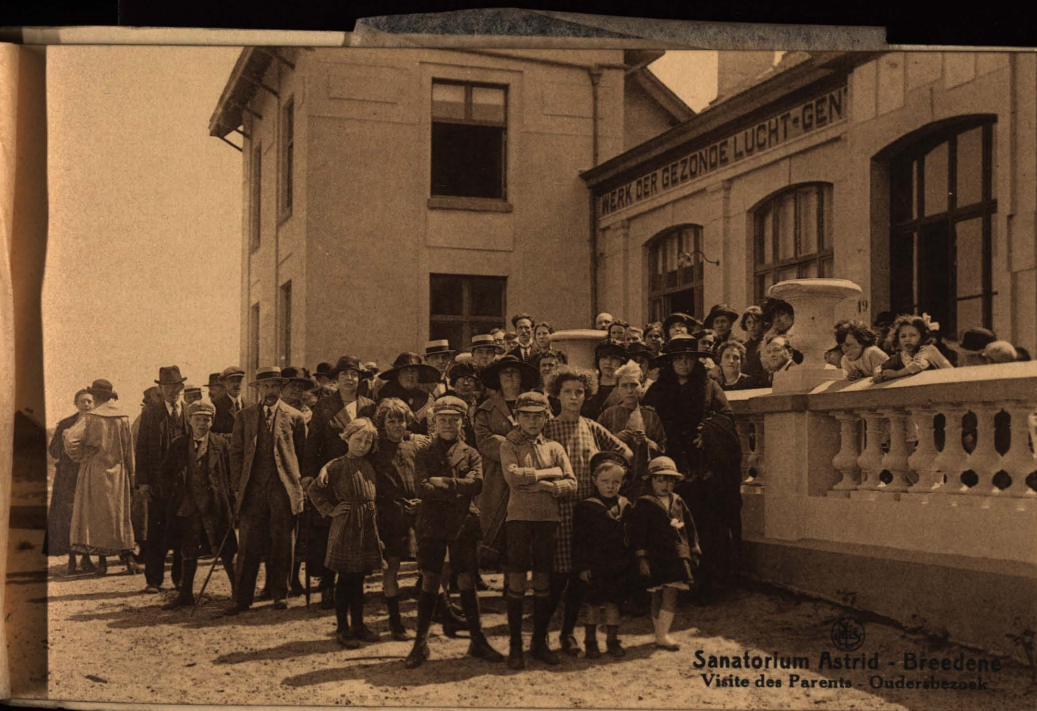
Sanatorium Astrid - Brederode Visite des Parents - Oudersbezoek

Œuvre du Grand Air - Gand. Werk der gezonde Lucht - Gent.