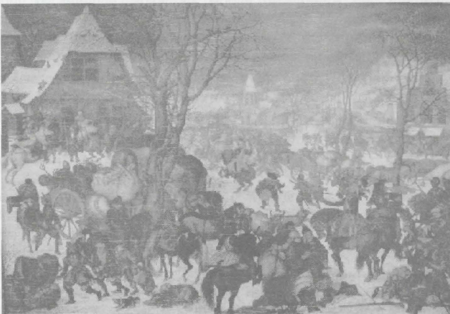
Plundering van een dorp, door Roeland Savery geschilderd in 1604 (° Kortrijk, 17 de eeuw)

In 1591 sloten het Brugse Vrije en de stad Brugge overeenkomsten met de vijand 66 opdat het platteland gevrijwaard zou blijven van brandschattingen en de scheepvaart via Sluis normaal kon verlopen maar we betwijfelen of dat alle vrijbuiters in toom heeft weten te houden.