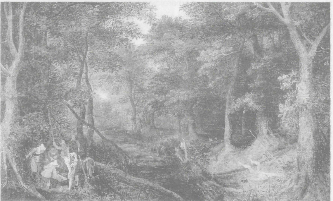
Overval in het bos, Jan Brueghel de Oude (ca. 1605)

Een bende van negen Engelsen, één Duitser en de Amsterdammer Heinric van Coevoorde van het garnizoen van Oostende waren in 1589 zonder veel planning uut ghecommen om buyt . Een vijandelijke legerbende onder leiding van een kolonel lieten ze ongemoeid omdat deze met teveel waren om aan te vallen. Onderweg stalen ze wel twee paarden en namen twee boeren gevangen. Uiteindelijk liepen ze in een bos zelf in een hinderlaag waar ze werden besprongen zodat zij verstroyt wierden . Ook de groep Oostendenaers waarvan Jooris Coppens deel uitmaakte, werd in Waasten verslegen ende verstroyt door een boerenmilitie of garnizoenssoldaten van Ieper toen ze langs een weg in een hinderlaag lagen. De 25-jarige Coppens kon weggelopen maar viel in de buurt van Brugge in handen van Spaanse troepen. Hij werd er op 3 januari 1586 opgehangen. Zijn bende was eigenlijk uuijtghelopen om een rekening te vereffenen met een man die in Oostende een paard van hen had gestolen. Ze vonden hem niet en probeerden dan een andere aanslag te plegen die faliekant afliep. Strooptochten waren gevaarlijke ondernemingen. Heinric van Coevoorde nam deel aan drie strooptochten die slecht afliepen. Bij een overval op een konvooi van Rijsel werd hij gekwetst en gevangengenomen. Zijn bende liep eens in een bos in een hinderlaag en werd uiteengeslagen. Hijzelf en vijf kameraden vielen toen in handen van de vijand. Een andere keer werd zijn bende opnieuw geslagen maar hij kon wegvlugten. 30