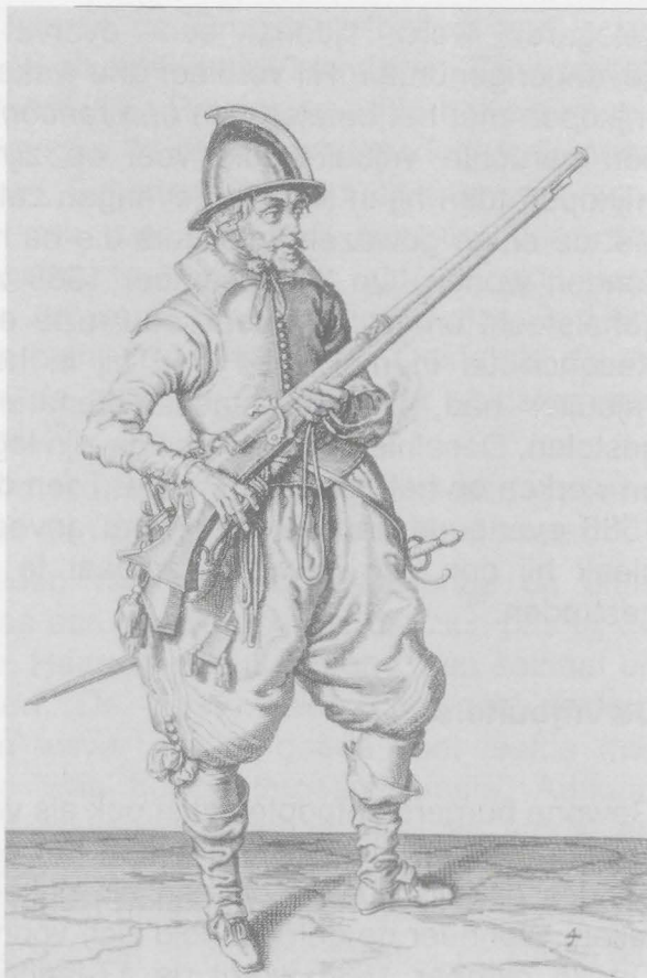
“Roerdrager” of soldaat gewapend met een roer of haakbus (Jacob de Gheyn, Wapenhandelinghe van roers, musquetten ende spiessen , 's Gravenhage, 1607)