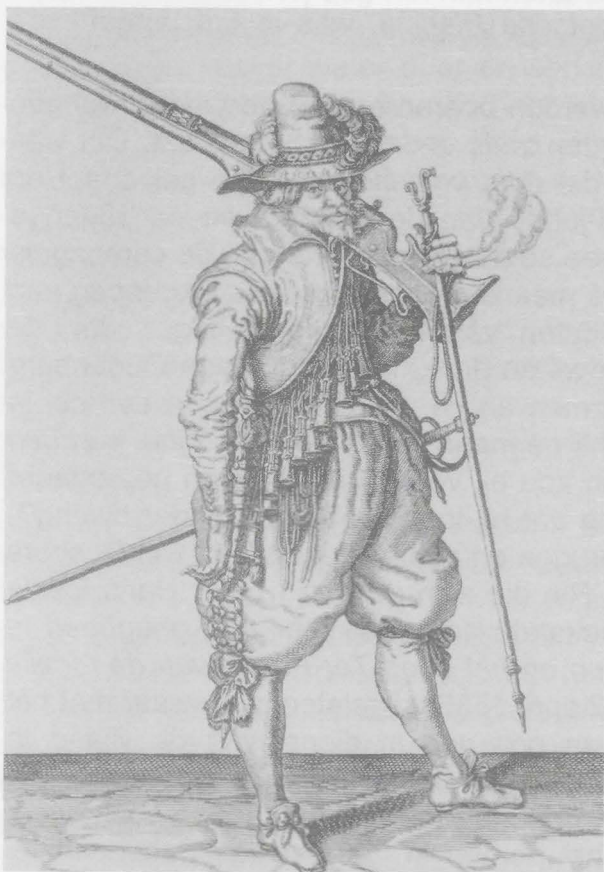
Een musketier uitgerust met een musket (Jacob de Gheyn, Wapenhandelinghe van roers, musquetten ende spiessen, 's Gravenhage, 1607)