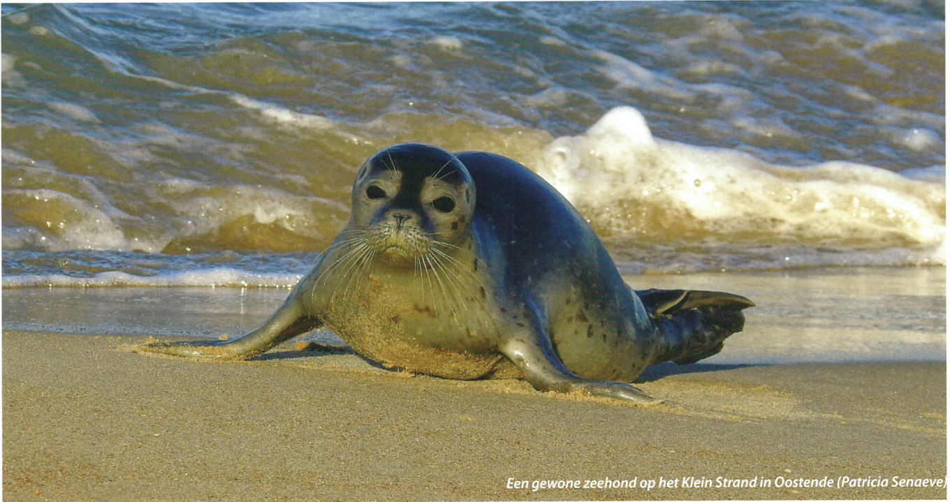
Een gewone zeehond op het Klein Strand in Oostende (Patricia Senaeve)