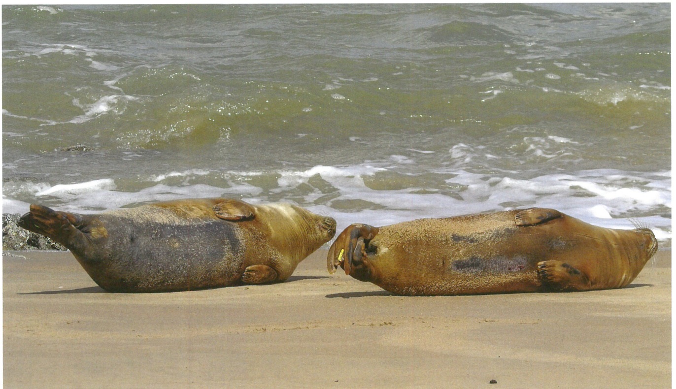
Rustende zeehonden op het strand met een aangebracht merkteken (Patricia Senaeve)

Zeehonden kunnen slapen, zowel op land als in zee. In zee slapen grijs zeehonden rechtop, zoals een drijvende fles of boei. De snuit steekt omhoog uit het water en de rest van het lichaam bevindt zich verticaal in zee. Grijs zeehonden worden door hun kegelvormige snuit ook wel 'kegelrobber' genoemd. Tijdens hun slaap daalt hun hartslag extreem, tot één slag per minuut. Hun metabolisme vertraagt zo sterk waardoor ze zelfs onder water kunnen slapen. Dan liggen ze stil op de bodem. Dat houden ze echter geen uren vol. Het zijn een soort power-naps die hun voldoende rust bieden om nadien weer verder te zwemmen. Als de zeehonden na zo'n lange reis terug aan land komen, moeten ze veel rusten. Vandaar dat sommige zeehonden dagen na elkaar op dezelfde vierkante meter strand blijven liggen. Het reizen, maar ook het zoeken naar voedsel, kost veel