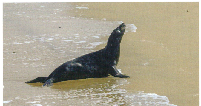
Een grijze zeehond is te herkennen aan de kegelvormige snuit (Patricia Senaeve)

Er komen twee soorten voor in Oostende: de gewone en de grijze zeehond. De gewone zeehond is het meest talrijk aanwezig, ook omdat die het in de ons omringende landen heel goed doet. Het zijn voornamelijk volwassen dieren. Dit wil zeggen dat ze niet meer afhankelijk zijn van de moeder. Gewone zeehonden planten zich voort in de vroege zomer. Ze hebben geen dikke vacht en kunnen vrij snel het water in. Dan gebeurt het wel eens dat ze verloren zwemmen en uitgeput op het