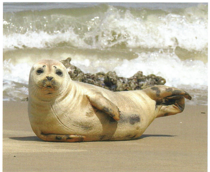
Gewone zeehonden liggen in de banaanhouding (Patricia Senaev)

baby. Daarom worden ze ook 'huliers' genoemd. Strandgangers merken soms een huiler op en denken onterecht dat het dier pijn heeft of hulp nodig heeft. Deze huliers zouden beter op het strand blijven liggen want het moederdier is nog ergens aan het rondzwemmen. Toch eist de publieke opinie in dat geval dat de hulpdiensten iets doen. Mensen worden soms boos dat de bevoegde instanties het jonge zeehondje gewoon laten liggen. Hier is het nog zo ver niet gekomen, maar er zijn gevallen bekend waar mensen zelf het heft in eigen handen nemen. Ze namen bijvoorbeeld het dier mee naar huis om het daar in hun badkuip te verzorgen. Of ze werden agressief tegenover de hulpverlener (die op dat moment geen actie ondernam). Hierdoor wordt zo'n huiler meestal wel meegenomen naar een opvangcentrum, ook al is dat niet de beste oplossing voor het dier op dat moment. Educatie en sensibilisatie is in deze heel belangrijk. Alleen kunnen we niet altijd ter plaatse zijn om de situatie goed te duiden. Er komen soms tientallen telefoontjes binnen voor hetzelfde dier. Gelukkig zijn er een aantal natuurliefhebbers die zelf een perimeter instellen op het strand of die bordjes met info plaatsen in de buurt van een rustende zeehond. Het is heel moeilijk om iedereen te bereiken. Zelfs toen ik op alle radiozenders van het land een interview gaf over de zeehonden op het strand, zijn er toch altijd mensen die van niets weten en het dier benaderen of er 'sealfies' van willen nemen.