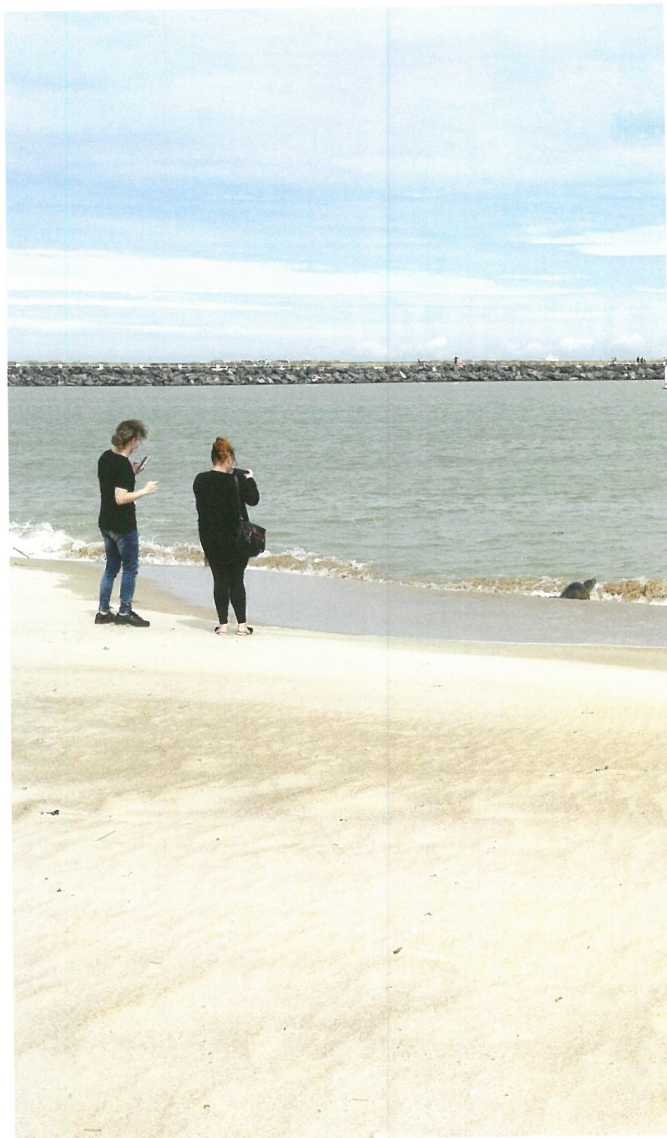
Zeehonden te dicht benaderen, bezorgt hen onnodige stress (Ruth Teerlynck)

andersom. Bekijk ze op een ruime afstand, met eventueel een verrekijker en laat ze verder met rust. Zo kunnen we nog lang genieten van de aanwezigheid van deze prachtige dieren.