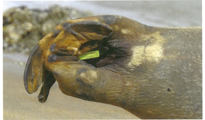
Een detail van een merkteken, aangebracht door het KBIN (Patricia Senaeve)

Dit onderzoek legt soms fenomenale trajecten bloot.