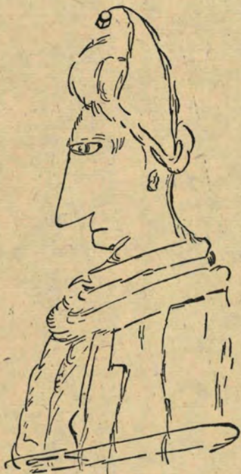
Un bourgeois de Dieppe en 1424.

(Dessin au trait exécuté au revers de la couverture d'un registre de comptes de Dieppe. — ARCH. DÉPART. SEINE-INF., G. 501).