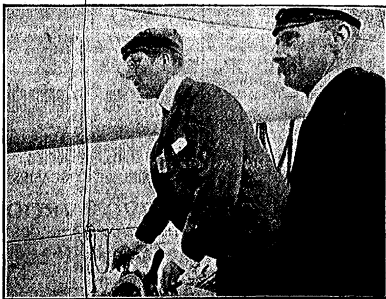
Koning Albert aan het roer.

Mocht de belangstelling van zijn zoon en opvolger Leopold III voor ons visschersvolk even groot zijn, dan zal onze visschersbevolking in hem den waardigen opvolger van den «Koning onzer Visschers» mogen begroeten.