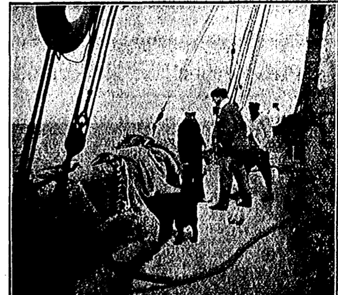
Koning Albert met de Ibis III naar zee.