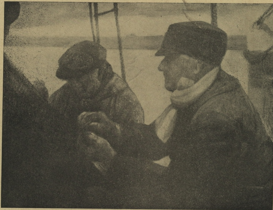
VISSERS AAN 'T WERK