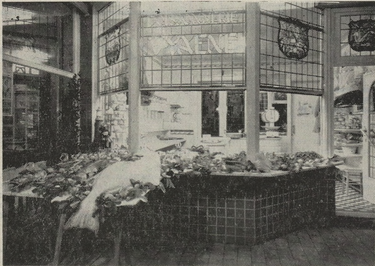
Deze foto geeft een duidelijk beeld van de modelwinkel van de heer Viaene te Koksijde. Konden we over het ganse land maar over meer zulke winkels fier zijn!

De winkel welke we zagen hoort aan Camiel Viaene te Koksijde en loont de moeite bezocht te worden.