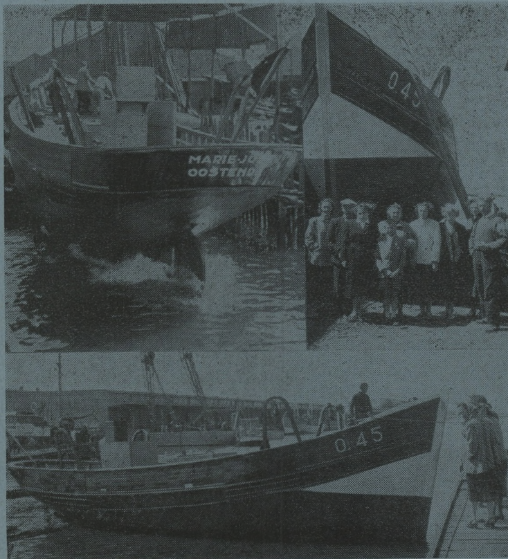
De tewaterlating van de 0.45