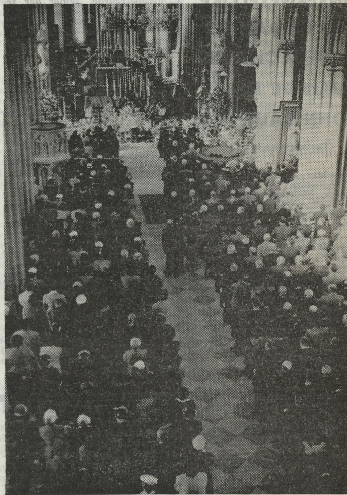
De plechtigheid in de Hoofdkerk.

We zullen de vissers en reders hiervan op de hoogte brengen.