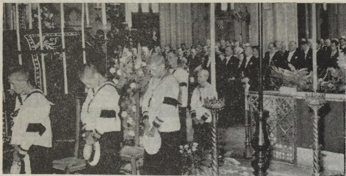
De Ibisjongetjes vormden de erehaag rondom de katafalk.