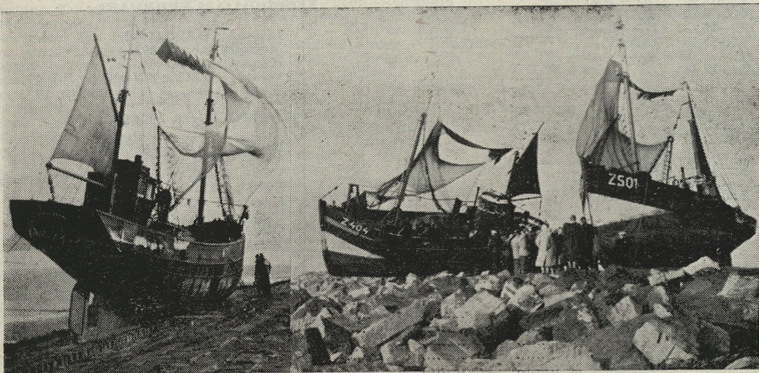
De drie Zeebrugse visserssloepen, Z.404, Z.501 en Z.525 op de golfbreker te Duinbergen.

Wij twifelen er niet aan of gans de visserij zal zaterdag in Carnegie te vinden zijn om er de diverse werpers-ploegen aan te moedigen en er ook een lustige avond door te brengen.