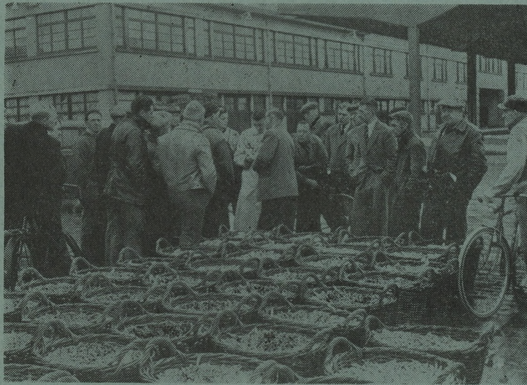
Een weinig bemoedigend toneel in de Oostendse vismijn tientallen bennen spröt, geen enkele koper...