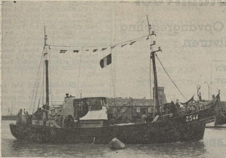
KROMHOUT 3-A -190 in de Z.544