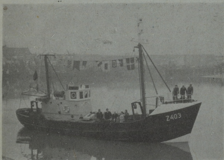
De Z.403 « Stern », de nieuwe eenheid van de Zeebrugse visserijvloot, die zondag plechtig gedoopt werd.

VAKBLAD VOOR : REDERS - VISSERS - NIJVERAARS EN HANDELAARS UIT HET BELGISCHE EN NEDERLANDSE VISSERIJBEDRIJF — VERSCHIJNT ELKE VRIJDAG —