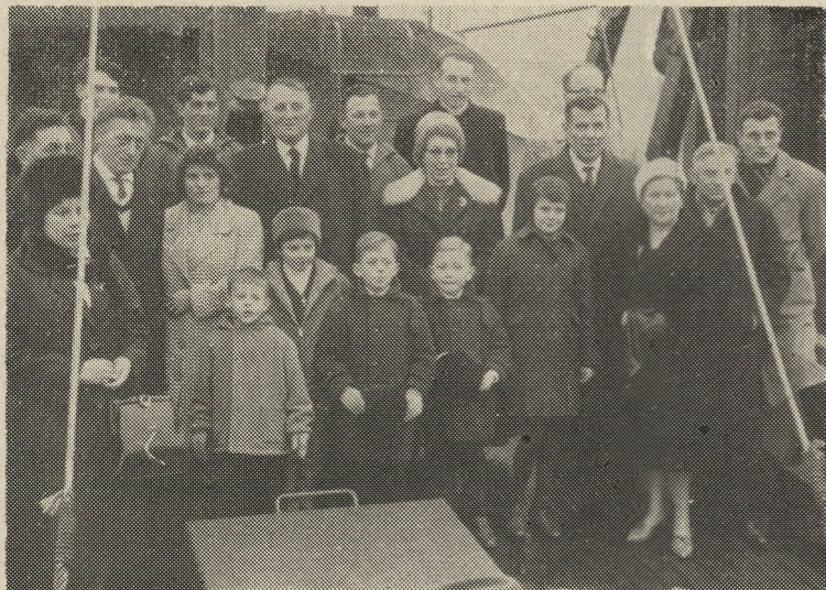
Reder, peter en meter, bemanningsleden en familie van het nieuwe vaartuig de Z.403, na de doopplechtigheid.

Nieuwste eenheid zondag plechtig gedoopt