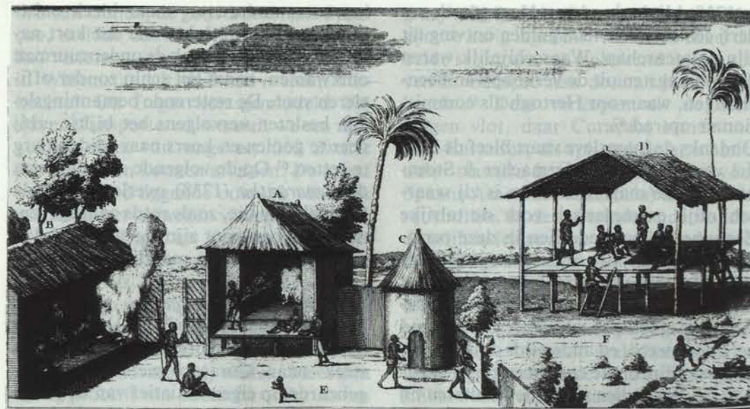
Maisons des Negres du Cap Mesurado A. Case des Negres du Cap de Mesurado. B. Cuisine. C. Case a mil et Rue magasin de terre Rouge. D. Salle ou les Negres s'assemblent pour leur Nigree et causer pendant le jour. E. Cour. F. Place publique.

Door het afbrokkelen van het WIC-monopolie na 1730 en de sterke aanwezigheid van Zeeuwse en Hollandse vrijhandelaars poogden de Braziliaanse schepen deze recognitie te ontlopen door reeds aan de Bovenkust slaven aan te kopen bij de vrijhandelaars. Voor de particuliere Guineavaarders vormde de functie van slavenleverancier een essentiële schakel om in deze periode goud, het meest winstgevendende produkt, te verkrijgen. Deze handel werd in de hand gewerkt omdat verscheidene burgeroorlogen de normale commerciële betrekkingen met de inlanders ontregelden, en bovendien de Brazilianen er niet voor terug schrokken op grote schaal goud te smokkelen. Vermoedelijk