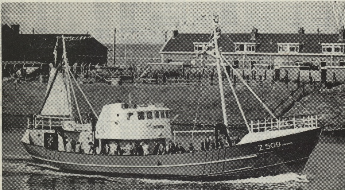
Het nieuwe vaartuig Z.509 « Telstar » op weg naar de thuishaven.

Zaterdag heerste er opnieuw vreugde, bewondering en vooral fierheid in vele harten. Zaterdag zal voor de nog jonge rederij «De Wielingen» een mijlpaal betekenen in het verder bestaan van de onderneming. Het is geen stap in het onzekere, geen blik in een vage toekomst, wel integendeel ... het is de realisatie van een droom die zowat twee jaar geleden een ondernemende familie ging obsederen. Een verwezenlijking die in veilige handen rust en waarvan mag gehoopt worden dat ze ook een grote toekomst tegemoet gaat.