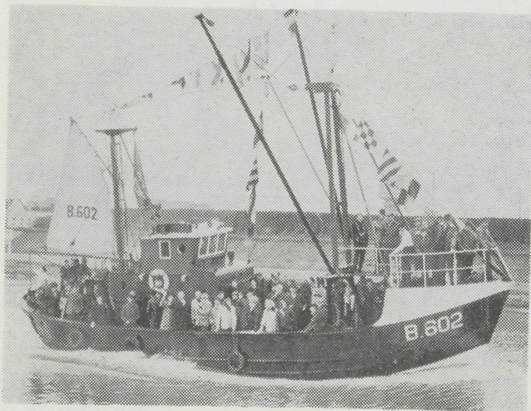
Sierlijk bevlagd verlaat de nieuwe Blankenbergse treiler de havengeul voor een korte proefvaart.