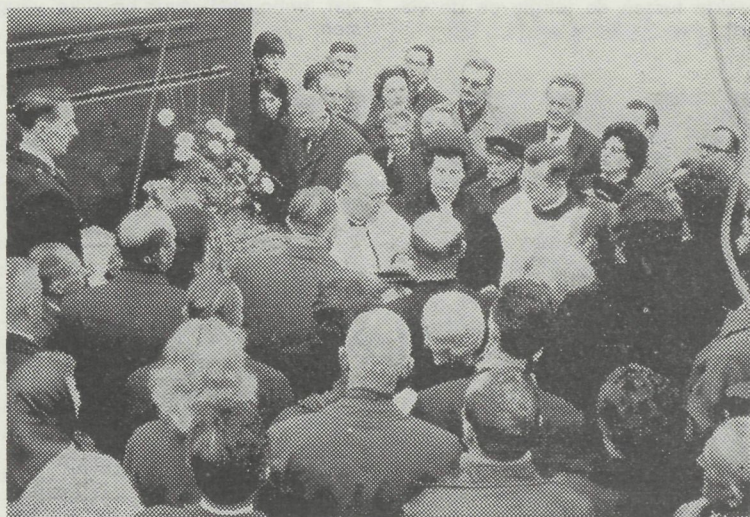
Een blik op de doopplechtigheid van de B.602 «Zilvermeeuw» onder een drukke belangstelling.

Men moet de feiten durven onder ogen zien, en in alle eerlijkheid toegeven dat de Blankenbergse haven als specifieke vissershaven reeds lang heeft afgedaan.