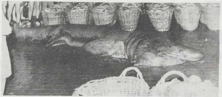
Op de dinsdagmarkt werd door de O.141 « Don Bosco » van de rederij « De Vuurtoren » een pelgrimshaai aangevoerd, die zowat 500 kg woog en een lengte had van nagenoeg 14 voet. De opbrengst van dit lieve diertje bedroeg evenwel slechts 20, F.