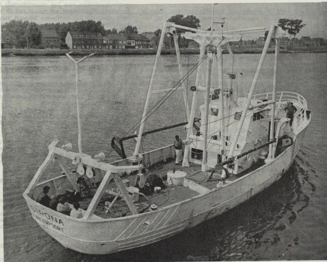
De N.704 „Girona” bij het verlaten van de werf