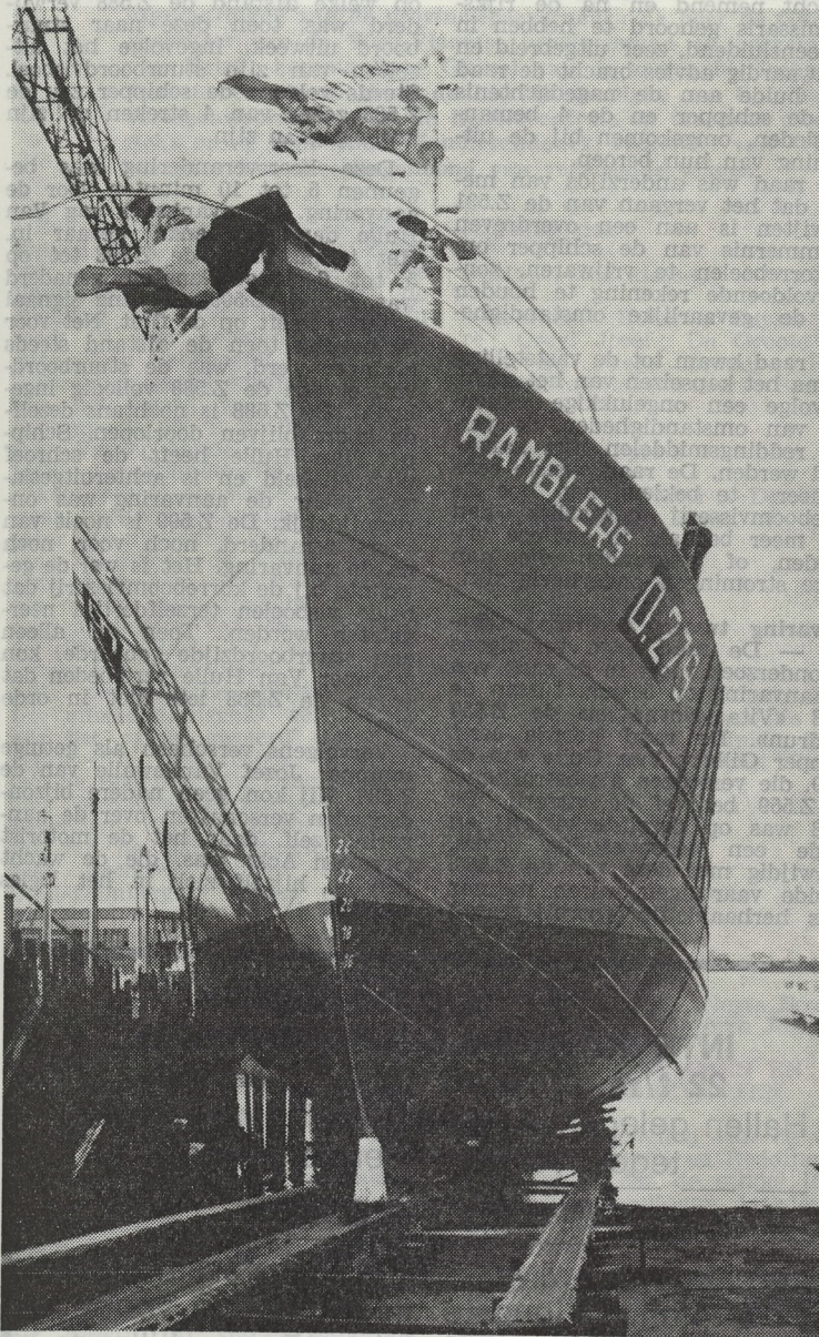
Even vóór de stapelloop...

Vorige week zaterdag luidde op de Oostendse scheepswerven Jos. Deweert andermaal de feesthoorn. Aanleiding hiertoe was de stapelloop van een nieuwe stalen konventionele treiler voor de plaatselijke vloot, nl. de O.279 «Ramblers» welke gebouwd wordt voor de gelijknamige redèrij.