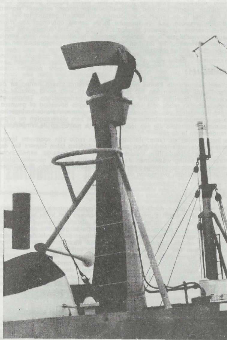
Parabolische radarantenne van moderne bouw geeft een smalle straal in het horizontale vlak (1,7 graad) en veroorzaakt gering bundeleffekt. Zelfs met windsnelheden tot 120 km. per uur draait dergelijke scanner steeds haar 20 toeren per minuut.

Het is dan ook van belang dat men op de brug op de hoogte is van de getijstand in de betrokken streek. Is het laag water dan zal men beslist de echo van een zandbank op het scherm zien. Verder zal de kracht van de echo verschillen naargelang de getijhoogte. De mogelijkheid is zelfs niet uitgesloten dat een zandbank die helemaal door het water is overspoeld nog een echo veroorzaakt op het scherm.