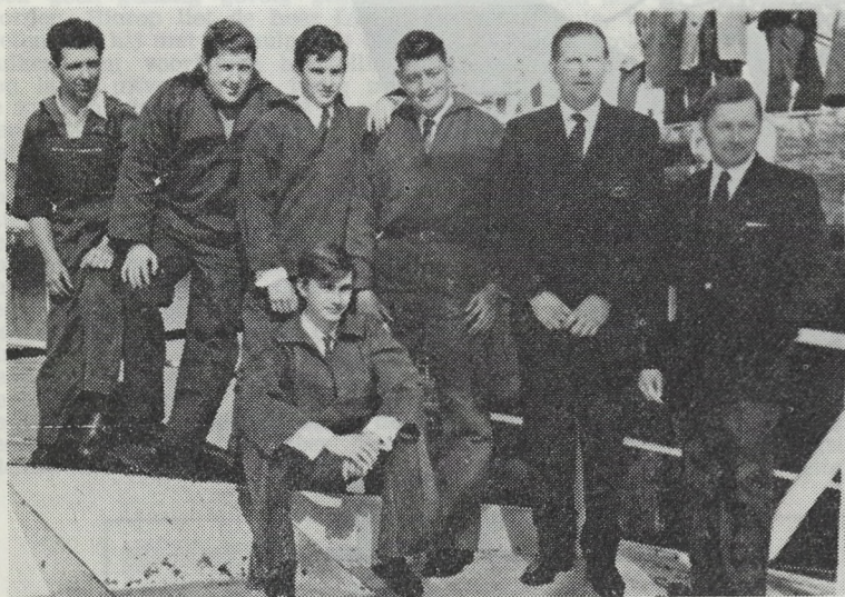
De bemanning van het nieuw vaarttuig.

Aan het staketsel tegenover de vismijn werd tijdens het jongste week-end de nagelnieuwe midden-slagtreiler Z.200 «Tijl Uilenspiegel» plechtig gedoopt door mede-pastoor Van Assel uit Heist.