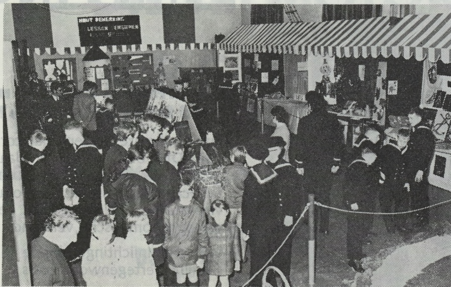
Een blik op de drukbezochte kontaktdag op de Ibis.

Vorige week zaterdag greep op het K.W. Ibis, naar jaarlijkse gewoonte een kontaktdag plaats. Dit gebeurt ieder jaar voor het paasverlof. Aldus krijgen de ouders en sympatisanten van de kostgangertjes een idee wat er nu precies gebeurt met hun kinderen. En dit is inderdaad heel wat; de opvoeders maken er werkelijk hun werk van. Terzelfdertijd werd ook een bezoek gebracht aan de school door de leerlingen van de onlangs opgerichte oudleerlingenbond van de Ibis, waarbij een koffietafel werd aangeboden. Onder deze mensen noteerden wij o.m. de aanwezigheid van oudleerling nr. 14. Een aanwezigheid die in ieder geval veel genoegen deed.