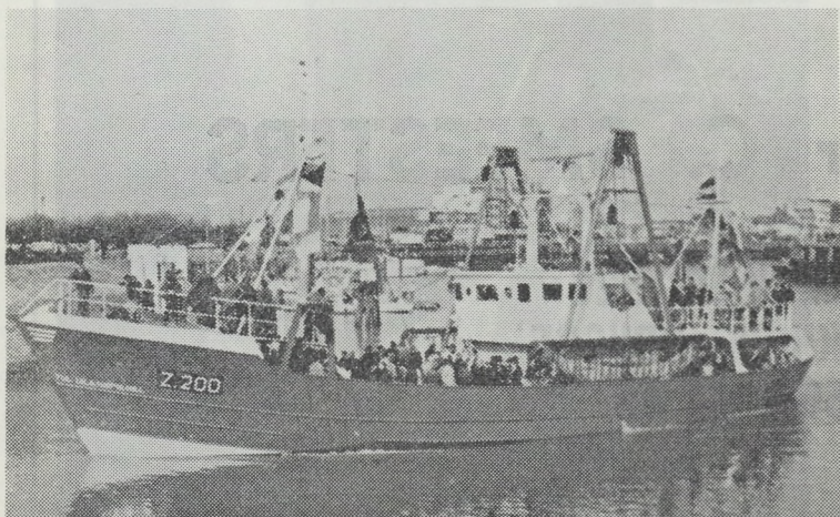
De Z.200 „Tijl Uilenspiegel” een flinke aanwinst voor de Zeebrugse vloot.

De firma SAIT-Electronics leverde de volgende apparatuur: een zender - ontvanger SSB IR 120 een tweede zender - ontvanger ER 570 W 3, dieptemeter Elac, VHF zender - ontvanger SD 20, Radar Marconi Raymark 12, elektrisch log SAIT en een mastercom.