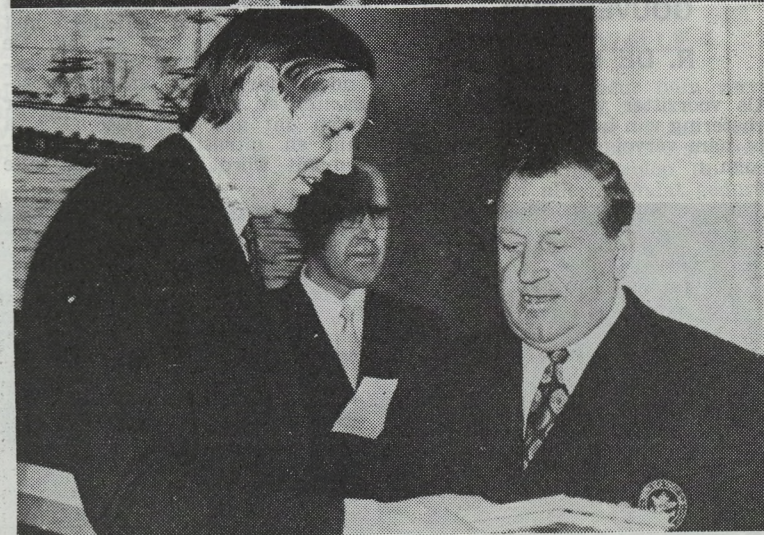
Enkele beelden van de geslaagde ontvangst op het Oostendse Stadhuis. De respectievelijke laureaten mochten ieder een mooi geschenk ontvangen. Waarvoor ook onze hartelijke gelukwensen.