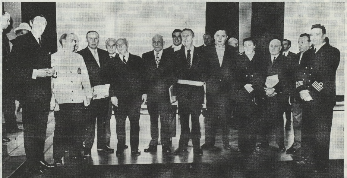
Nog een beeld van de ontvangst die de verdienstelijke vissers (zie art. blz. 4) op het Oostends stadhuis aangeboden kregen.

Indien men geen B.T.W. heeft betaald dan vult men in het daarvoor voorziene vakje « nihil » in.