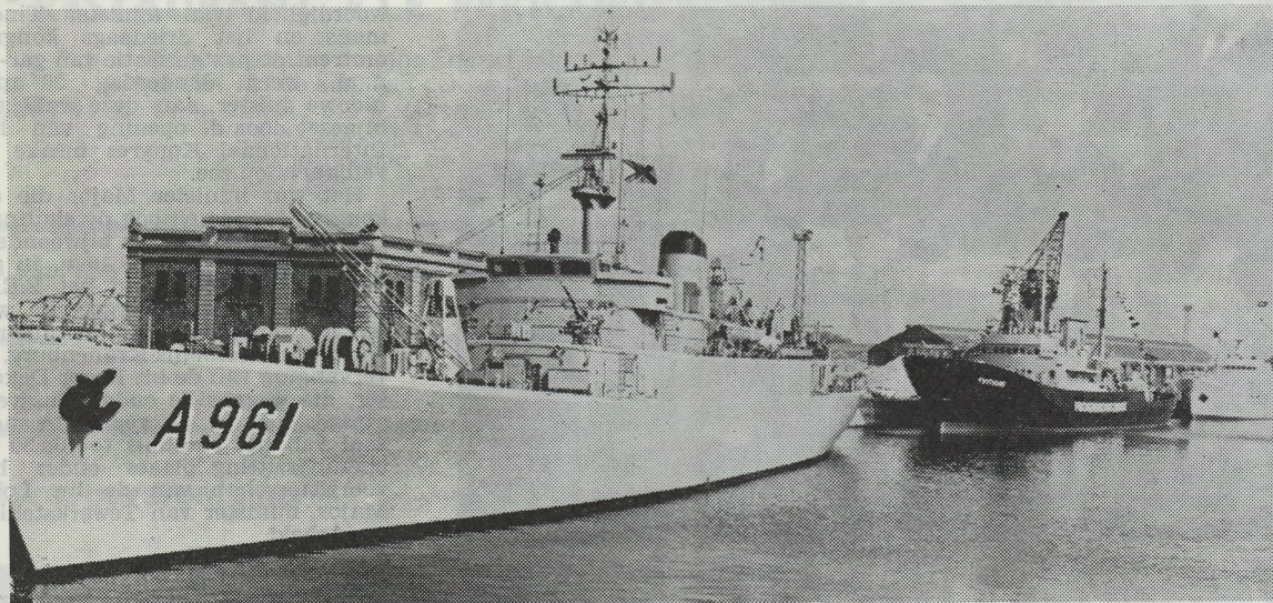
Internationale vlootparade te Oostende, de „Zinnia”, de „Frithjof” en „De Hoop” gemeerd in het vlotdok.

bedanken en zijn overtuigd dat hij zijn steentje zal bijdragen om die veiligheid te helpen verhogen.