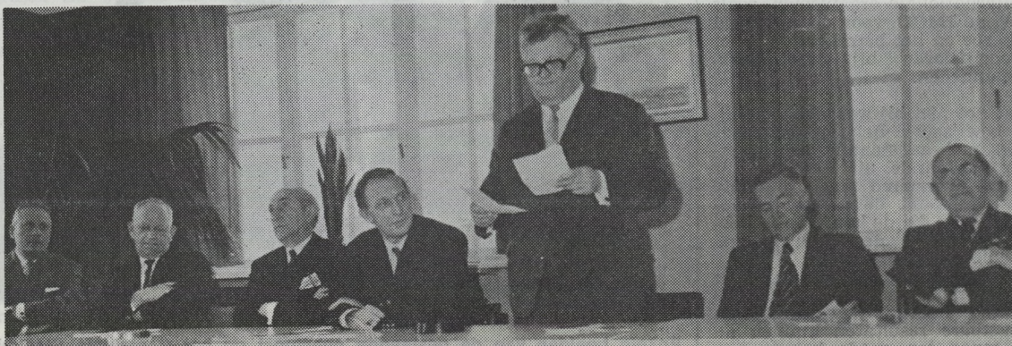
De delegaties van het Paritair Komitee werd ook te Zeebrugge ontvangen.