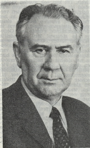
De heer Josepsson, IJsland minister van Visserij.

Blijven wij toch even bij laatstgenoemde « berucht » geworden minister. De heer Josepsson stamt af van een boerenfamilie en heeft steeds gestreefd naar een rationeel