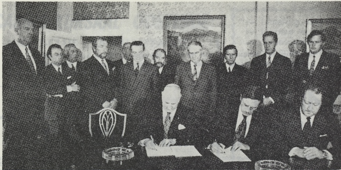
Het ondertekenen van de overeenkomst...