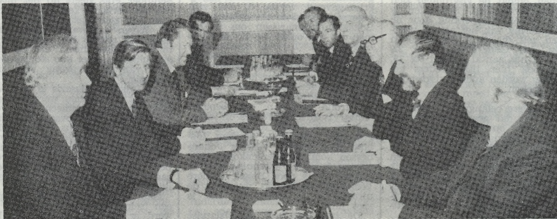
Een zicht tijdens de onderhandelingen.