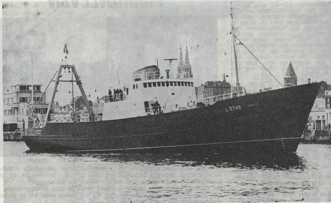
De eenheden van de wereldvloot werden steeds groter en vergen derhalve voortdurend forsere investering. Het onderhoud van de treiler is derhalve van „kapitaal” belang in de bedrijfsduur.

Bij ons bezoek vielen de veiligheidsmaatregelen op. De verffabricage is niet van gevaren ontbloot en jaarlijks zijn er 1 tot 2 min of meer ernstige ongevallen te betreuren. Overal worden weliswaar plakbrieven aangebracht die er de werknemers op wijzen vooraf eerst de veiligheid in acht te nemen. Maandelijks worden ook brandalarm-oefeningen gehouden door de eigen brandweerploeg. Opvallend tenslotte is het respect vanwege de ondernemingsleiders voor de streektaal, want ook dat vinden we belangrijk.