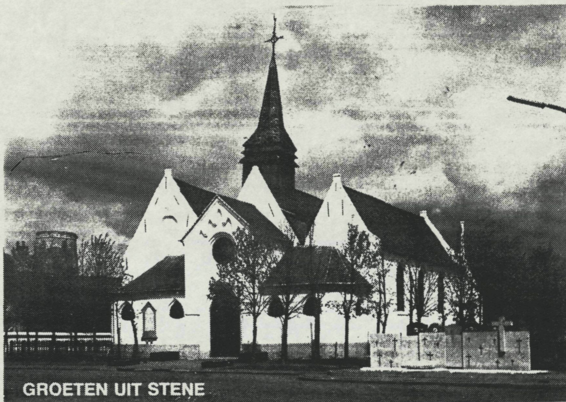
GROETEN UIT STENE