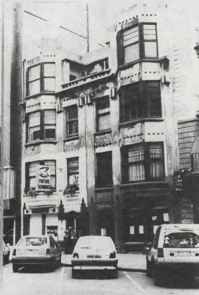
Van Iseghemlaan 24-26b arch. Corneau