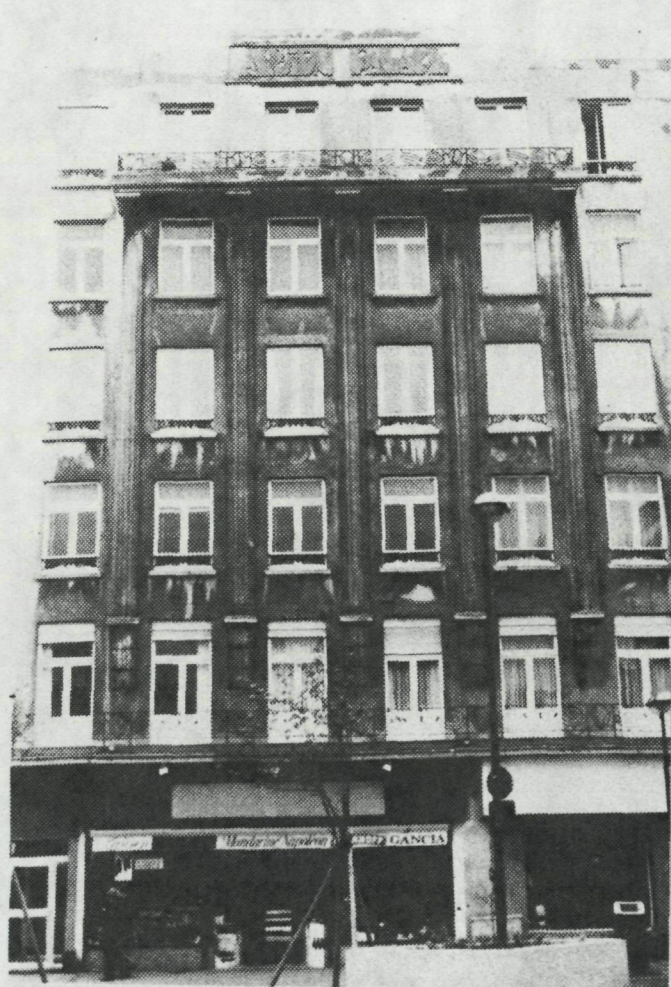
Groentenmarkt 2 Albion Palace

Vlaanderenstraat 17 : CECILE'S PUB - arch. Vanhille Art Nouveau