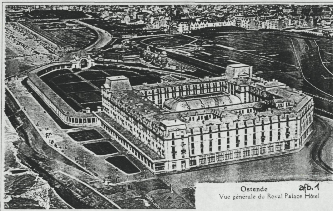
Ostende afb. 1 Vue générale du Royal Palace Hôtel