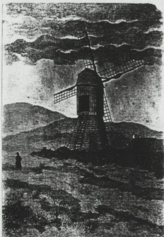
LE MOULIN D'ALBERTUS-SUR-MER (lez-Oostende)

Samen met deze stallingen emigreerden nog andere nijverheden uit Oostende, zoals een brouwerij en een oesterput. Want de prijzen van de gronden rezen daar gauw de pan uit. Ook de aangespoelde "nieuwe rijken" zochten krenterig naar goedkope gronden en bouwden weldra de Aartshertogstraat vol. Die buurt heette zichzelf daarop zelfbewust de Albertuswijk. Koning