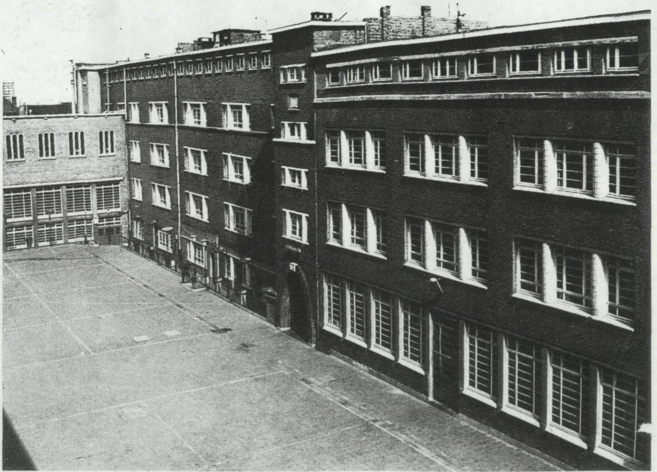
Verruiming gebouwen van 1923 en 1938 en nieuwbouw (zijde speelplaats), 1948-'50.