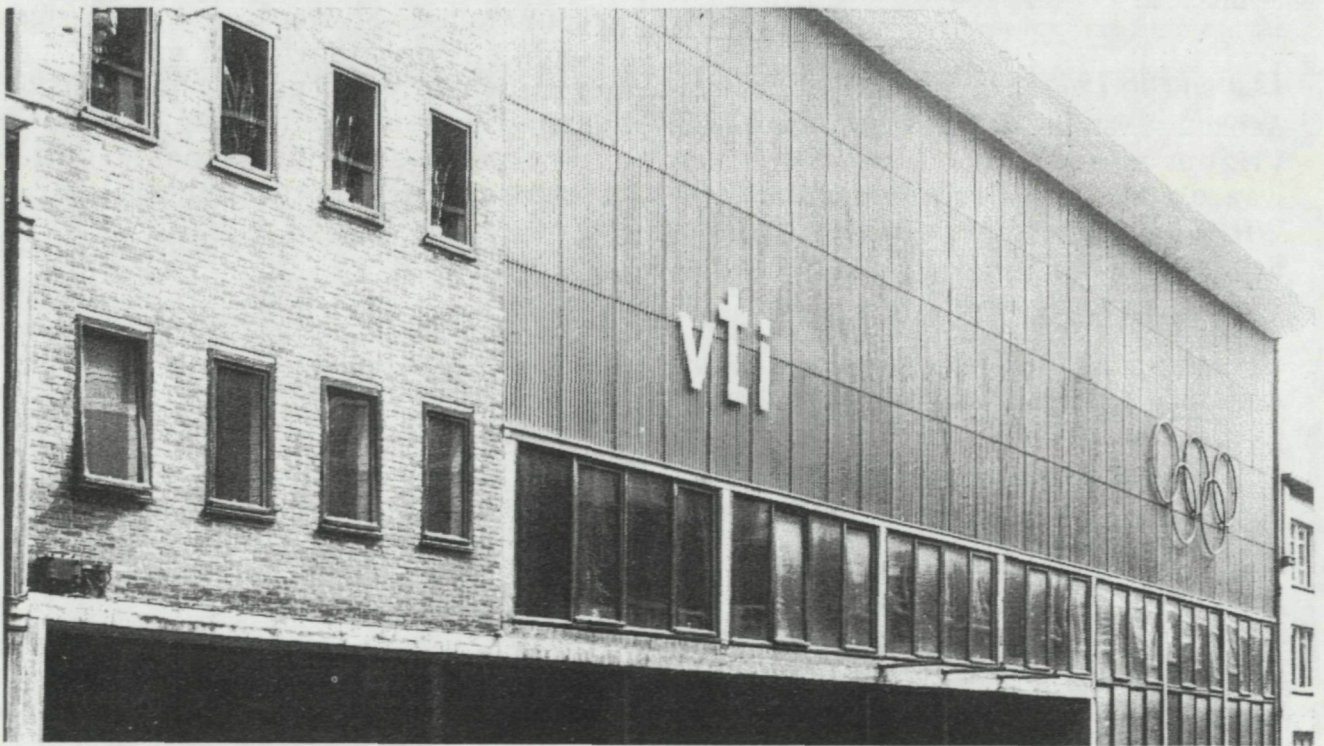
Sporthal (Duivenhokstraat), 1966-'68.