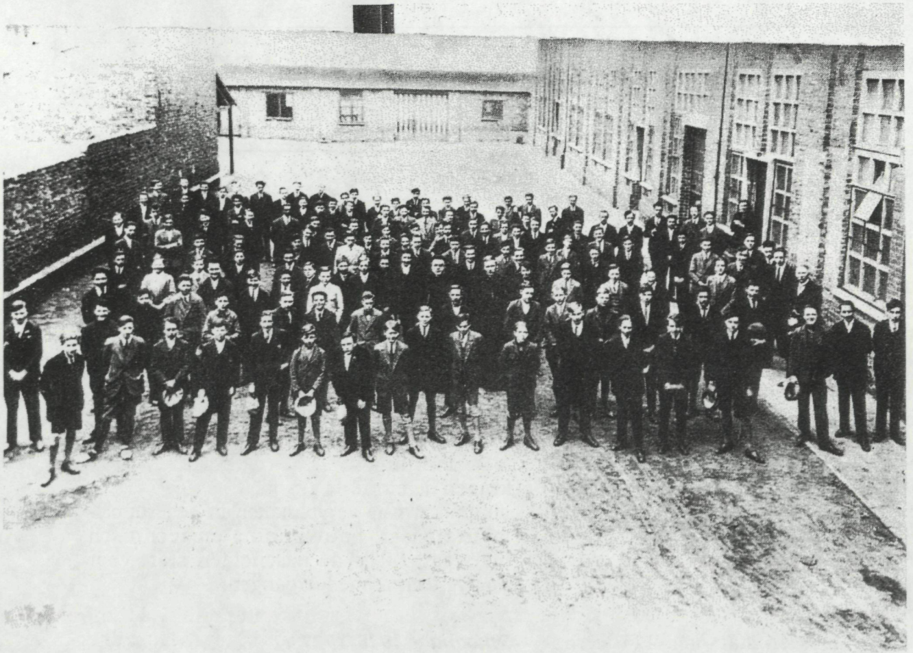
Vrije Technische School 1926-'27.

Verruiming gebouwen van 1923 en 1938 en nieuwbouw (zijde Duivenhokstraat), 1948-'50.