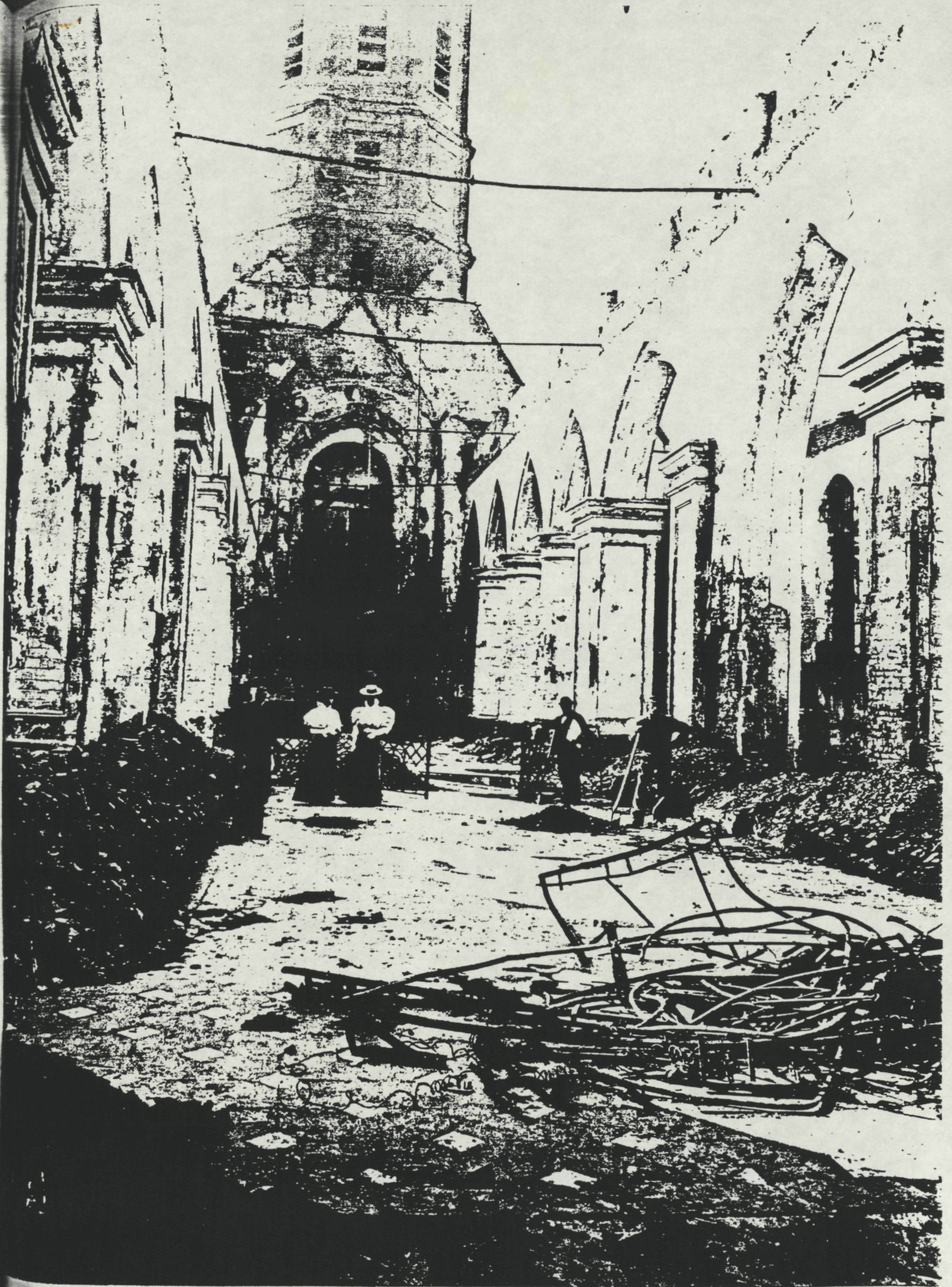
Fig. I: Zicht op de Middenbeuk van de afgebrande Kerk