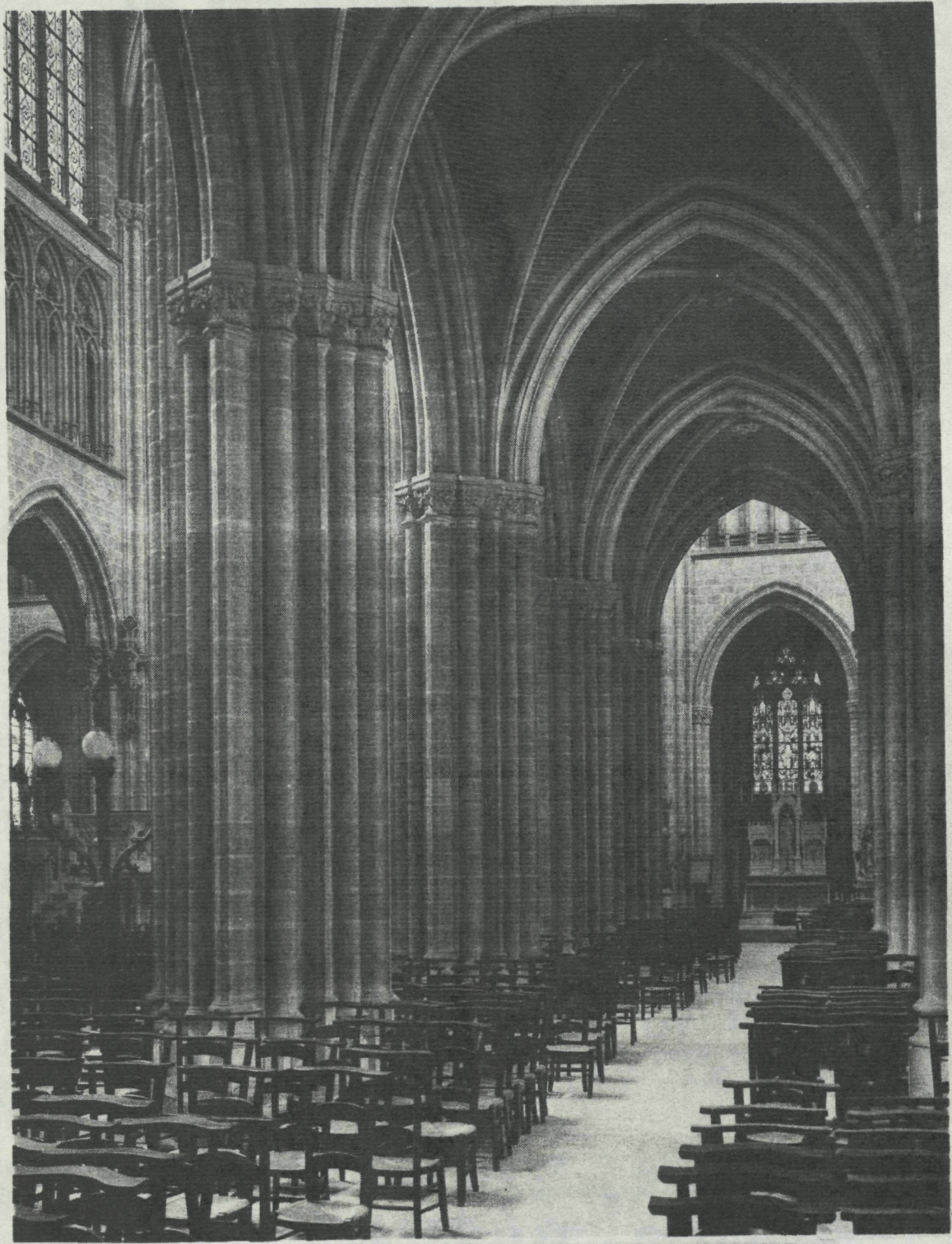
GEZICHT OP DE RECHTERDWARSBEUK MET HET ZIJALTAAR GEWIJD AAN DE MAAGD MARIA, MET LINKS HET TAFEREEL "BOODSCHAP AAN MARIA" EN RECHTS "MARIA HEMELVAART".