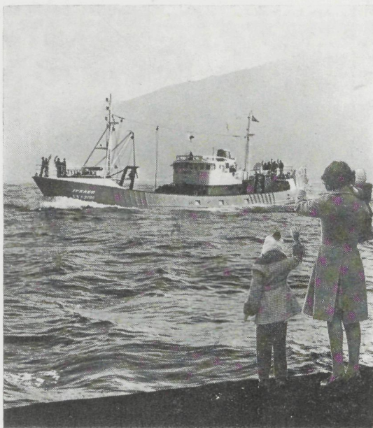
„Itxaso” : Spaanse vissers- boot - 8MDXC 1080 pk - 750 rpm