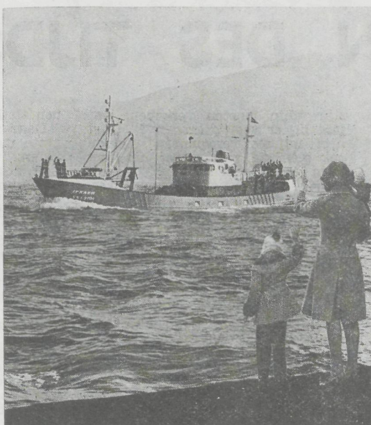
„Itxaso” : Spaanse vissers- boot - 8MDXC 1080 pk - 750 rpm