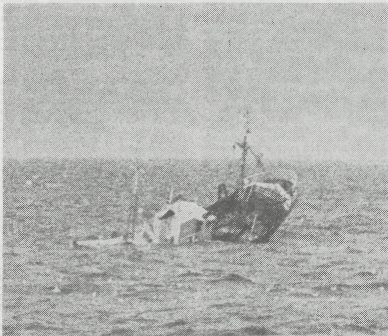
Zo verging de N.159 «Avondster» na een zware lekkage in de motorkamer.

In amper drie weken tijd zijn evenveel treilers naar de haaien gegaan. Het begon met de O.224 «Noordzee» die zware lekkage opliep in de motorkamer en verging. Eén week later kwam de O.312 «Angelus» niet terug van de visgronden na een verwoestende brand en tijdens het jongste weekeind ging de N.159 «Avondster» de dieperik in; weeral na een lekkage die zonderling genoeg, vastgesteld nadat het vaartuig reddeloos verloren was.